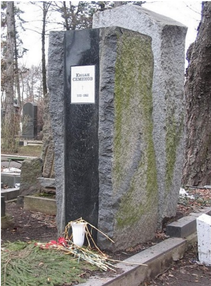
Могила-кенотаф Юлиана Семенова