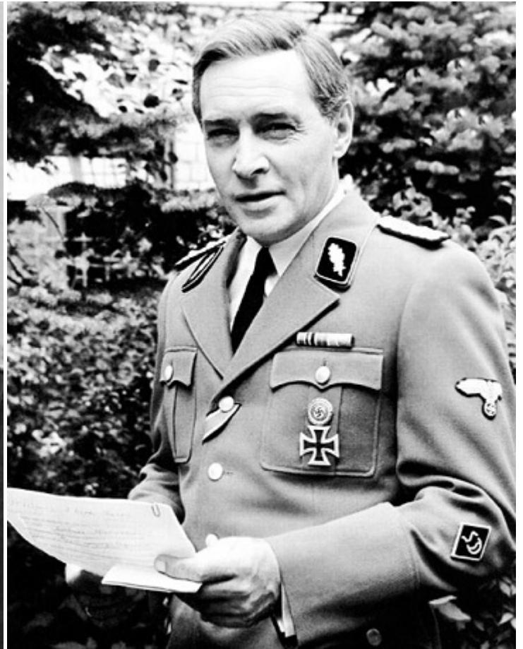
Вячеслав Тихонов в роли Штирлица

Благодаря характерам, искусно выписанным Юлианом Семеновым, четко выверенной режиссуре Лиозновой и блестящей игре Тихонова, Броневого, Табакова и далее по списку главные герои получились не карикатурными, а умными, рассудительными и сметливыми врагами. Партия и правительство высоко оценили картину: в 1976-м ее создатели были удостоены Государственной премии СССР, а через два года — премии КГБ.