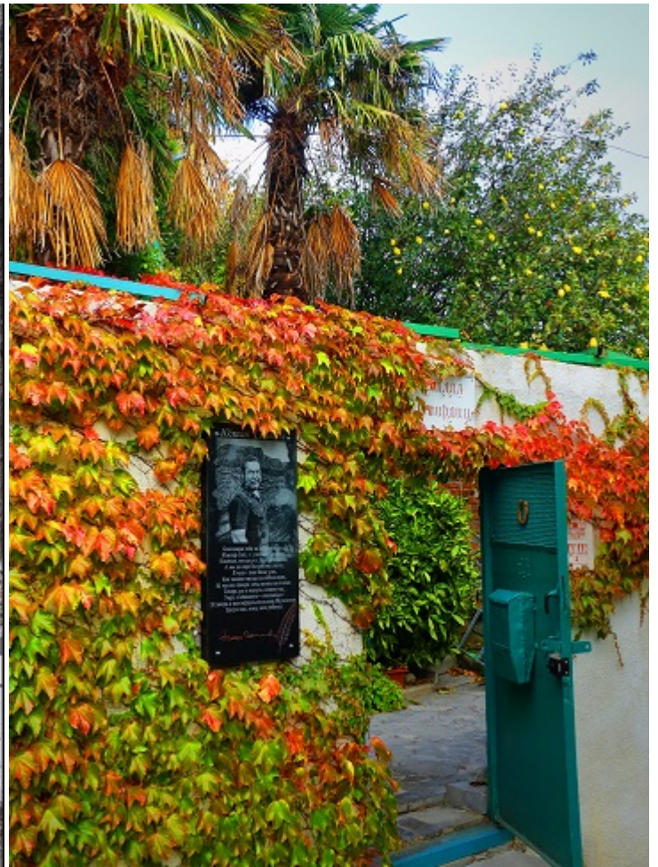
Вход в музей Юлиана Семёнова, пос. Олива