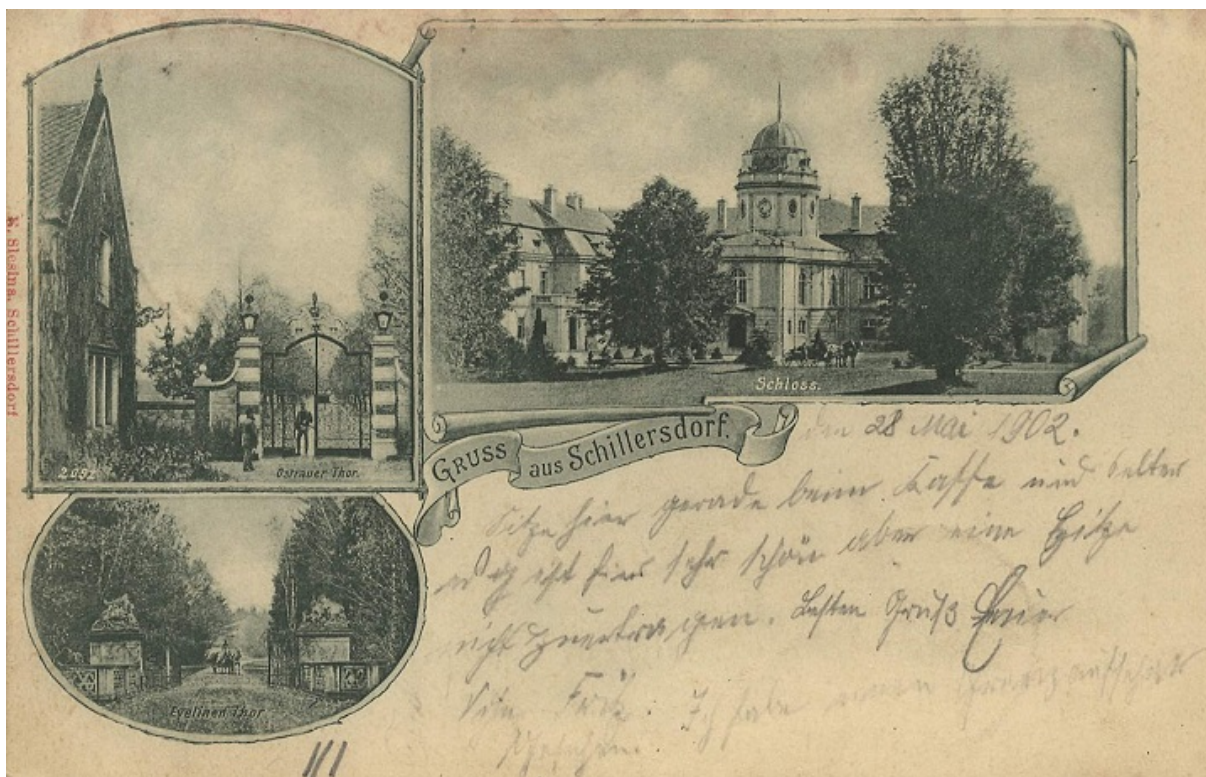
Открытка 1902 года с изображением имения Ротшильдов