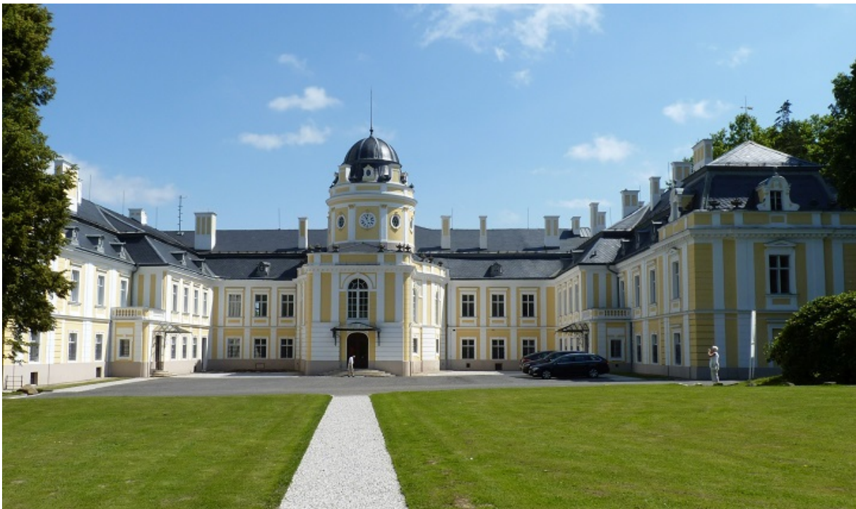
Так выглядит замок в Шилгержовице сегодня