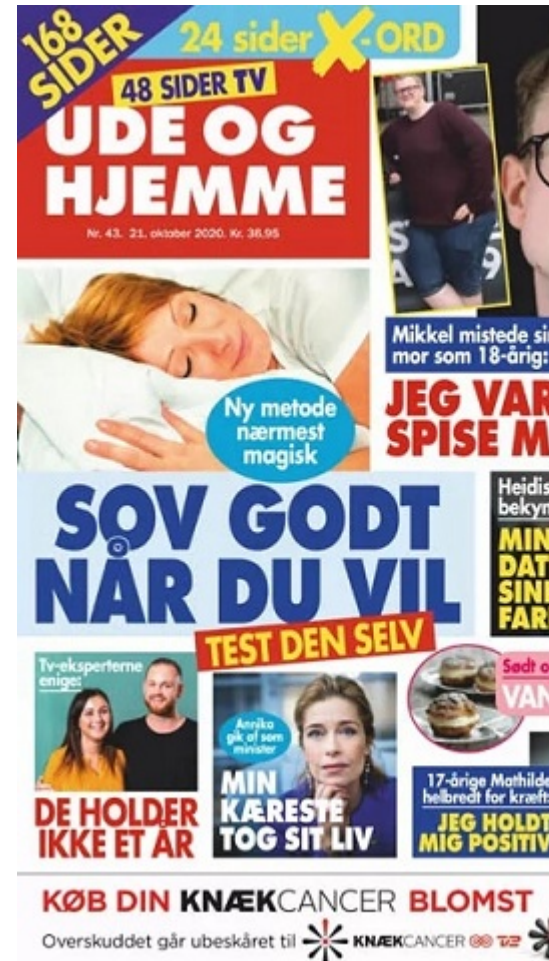
Так выглядит журнал Ude og Hjemme сегодня