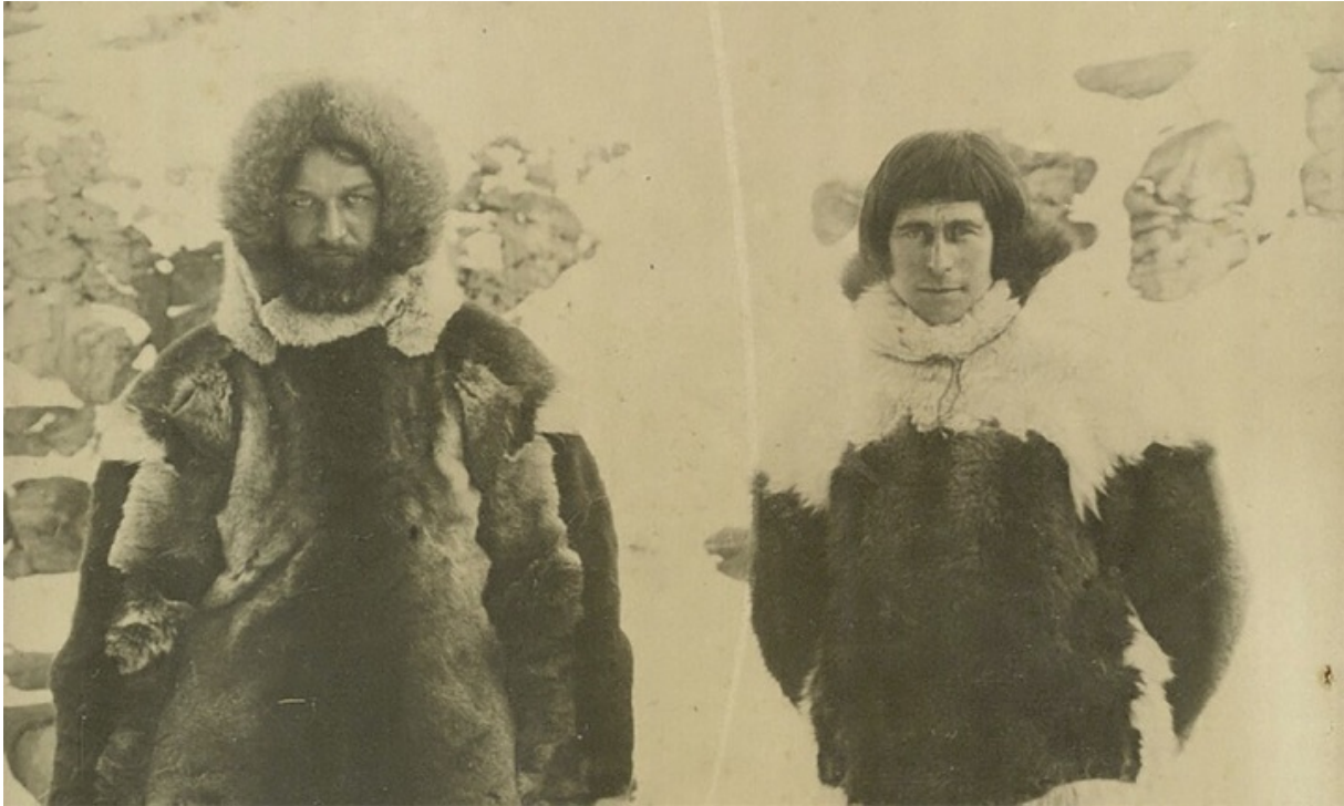
Петер Фрейхен и Кнуд Расмуссен в Гренландии.

Жизнь эскимосов была чрезвычайно трудна. Они страдали от голода и холода и были практически не знакомы с достижениями современной цивилизации вроде металлических ножей, керосиновых ламп и огнестрельного оружия. Китобоям, снабжавшим местных жителей товарами первой необходимости, далеко не каждый год удавалось пробиться сквозь льды и добраться до северной оконечности острова, чтобы торговать с гренландцами. Тогда Расмуссен и Фрейхен основали здесь собственную факторию — торговую базу, где эскимосы могли бы обменивать охотничьи трофеи на нужные им вещи.