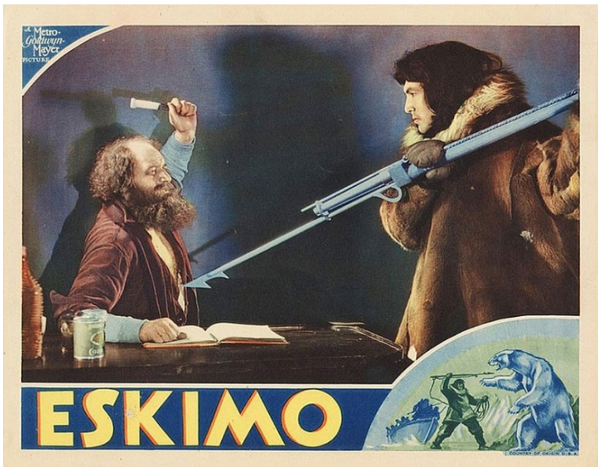
Постер фильма «Эскимос», слева - Петер Фрейхен

В 1932-33 годах Фрейхен нанялся в Metro Goldwyn Mayer и организовал съемки на Аляске. Он одновременно выступил сценаристом, переводчиком и сыграл в «Эскимосе» роль главного злодея — капитана промыслового судна, который вторгается в размеренную и счастливую жизнь молодой эскимосской семьи. Все диалоги в фильме были озвучены на эскимосском языке с английскими субтитрами, а главные роли сыграли местные аборигены, продемонстрировавшие в фильме традиционные способы охоты, рыбной ловли и древние обычаи инуитов.