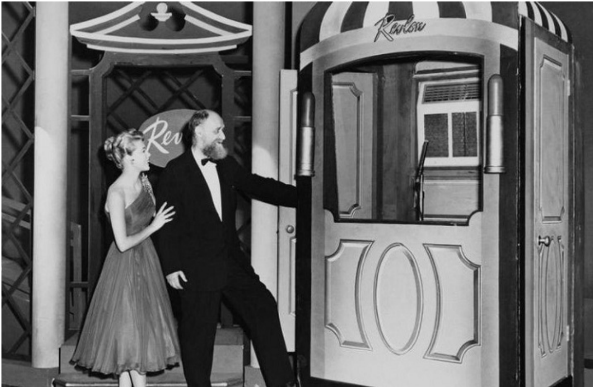
Фрейхен на телевикторине «The $64 000 Question», 1956 год.

С трудом можно представить рыжего гиганта-датчанина на деревянной ноге в окружении стильных манекенщиц и модельеров на какой-нибудь нью-йоркской модной вечеринке, но в начале 1950-х все выглядело именно так. В перерывах между новыми экспедициями и съемками кино Фрейхен вел активную светскую жизнь, раздавал интервью и не забывал писать многочисленные книги о своих приключениях.