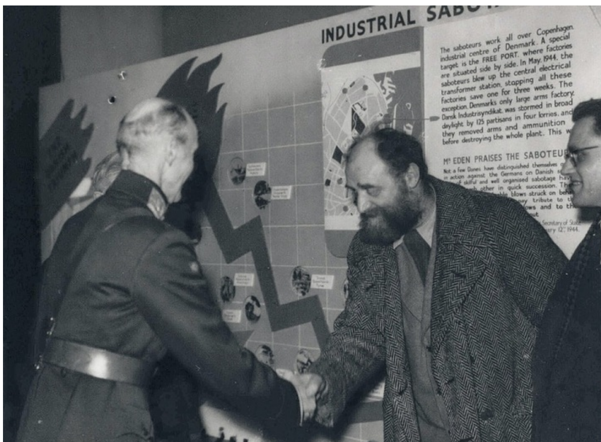
Петер Фрейхен в Англии, 1944 год.

9 апреля 1940 года, в нарушение мирного договора, войска Вермахта начали Датско-Норвежскую операцию, и уже через час король Дании отдал приказ сложить оружие. Страна перешла под немецкий контроль.