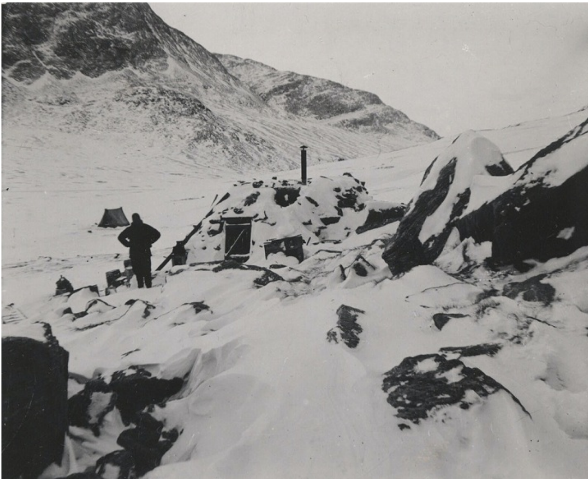
Стоянка экспедиции в Гренландии.

Едва хорошенько выпавшийся Петер оторвал бороду, примерзшую к «полу», он осознал, что оказался заперт в тесной снежной пещере, стены которой от дыхания покрылись толстым слоем льда. Очень быстро стало понятно, что пробить ледяной панцирь самостоятельно не получается. Крепкий нож, как и все остальные инструменты, остались в багаже на санях, и добраться до них невозможно. В полной темноте и одиночестве Фрейхен размышлял, как ему выбраться из западни.