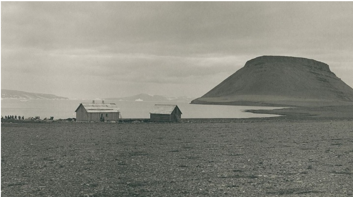
Так начиналась фактория Туле, 1910