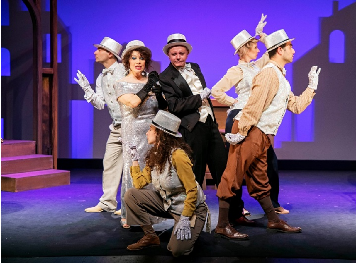
На одном из спектаклей театра «Идишпиль»

В воскресенье, 18-го июля 1948 года редактор коммунистической газеты «Коль ха-Ам» Меир Вильнер явился в военкомат по ул. Калишер в Тель-Авиве для несения воинской службы. На рутинный вопрос, какие языки он знает, Вильнер ответил: иврит, польский, немецкий и идиш. Офицер заявил, что идиш — не язык. Вильнер возмутился, но ему возразили, что издан приказ верховного командования: идиш — не язык. Ивритские газеты отнеслись к инциденту без удивления, мол, идиш — наследие галута (диаспоры), и в новом государстве ему нет места.