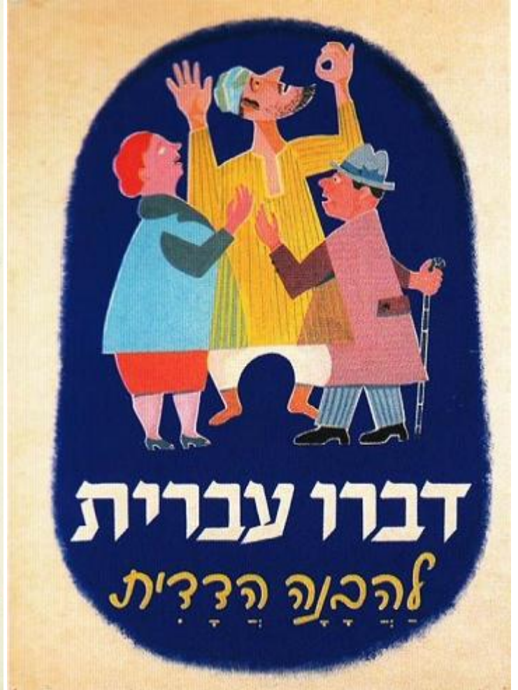
Израильские плакаты, призывающие говорить на иврите

Но объяснить можно и политику Евсекции (создание новой национальности советских евреев). И даже советский государственный антисемитизм (после Холокоста евреи больше не отвечали сталинскому определению национальности, а после образования Израиля и вовсе стали иностранной национальностью, вроде немцев, поляков или корейцев, и их надо было ассимилировать). Можно найти внутреннюю логику в любой политике в истории человечества.