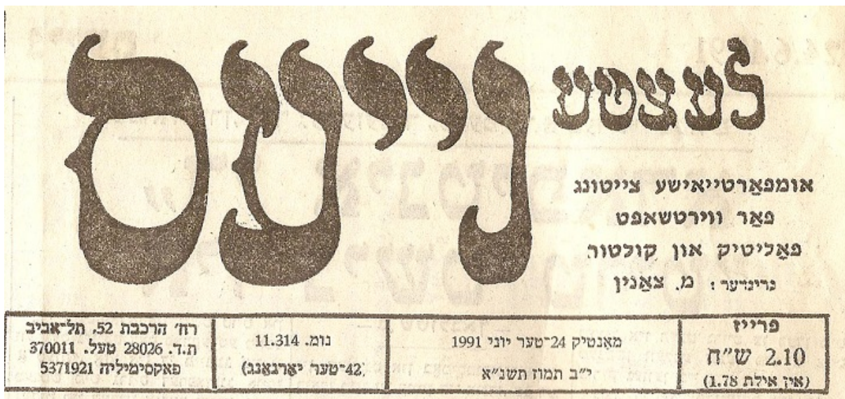
Шапка газеты «Лейце найес»

В идишской журналистике пробовал себя и Ури Авнери, которого я однажды назвал «последним саброй» . Он пробовал издавать идишский перевод своего радикального журнала «Ха-олам ха-3э», но быстро понял, что идишский читатель нуждается не в переводах ивритской прессы, а в качественной оригинальной журналистике.