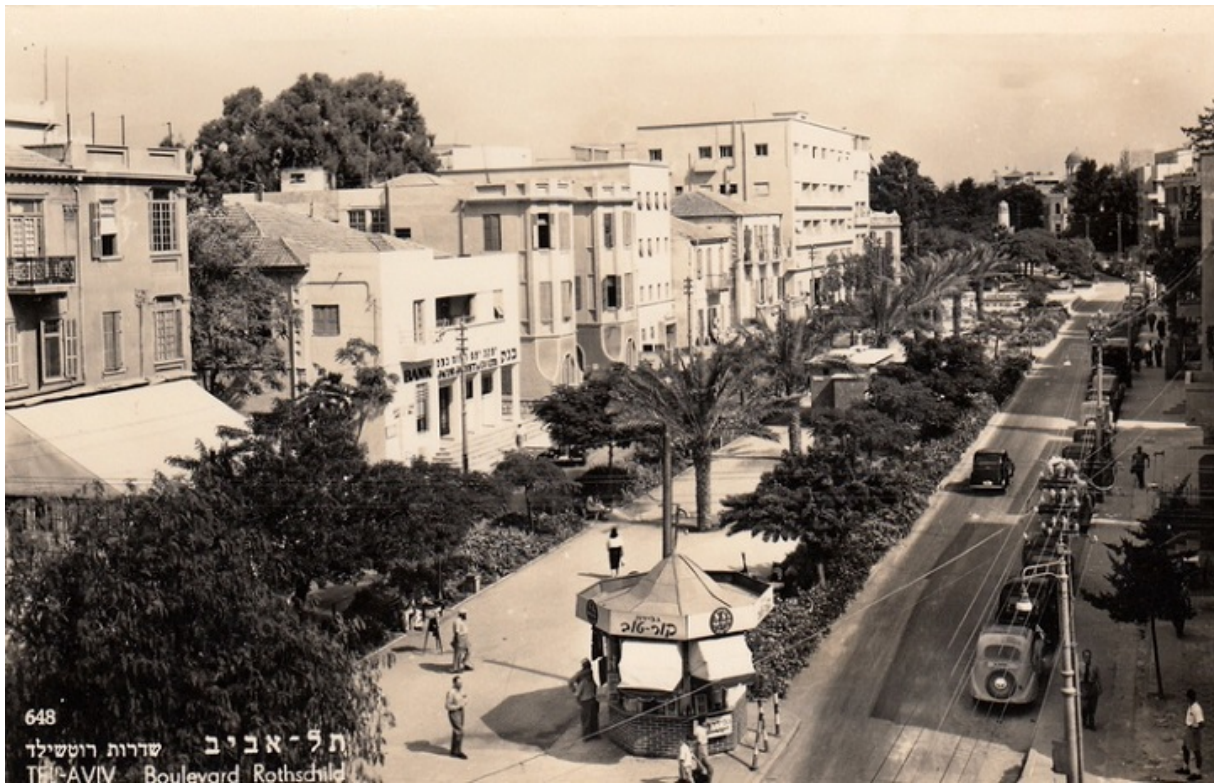
Первый еврейский город в новейшей истории - Тель-Авив, 1930-е

Идиш отменяли в угоду экстремистской идее шлилат а-галут (отрицания диаспоры). Две тысячи лет истории «между Танахом и Пальмахом» (фраза писателя Йорама Канюка) считались вредными и подлежащими забвению. В этой парадигме культуре на идише и других еврейских языках (ладино, иудейско-арабском, бухарском и др.) было «приказано исчезнуть». По современным понятиям, тон сионистской пропаганды вплоть до конца 1970-х можно запросто назвать антисемитским.