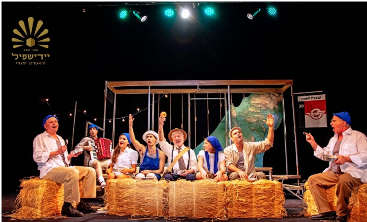
Сцена из спектакля театра «Идишпиль»

Существует обширная мифология о том, почему Бен-Гурион пошел на соглашение с харедим о статусе кво. Однако никакой политической подоплеки в этом не было. Ультраортодоксы тогда не участвовали в израильской политике. Бен-Гурион сам вспоминал, что встретился с их лидерами уже после того, как принял решение не вмешиваться в жизнь их общин, не призывать в армию студентов иешив и не принимать мер, ставивших под угрозу существование а идише ойлем — мира Торы, уничтоженного Холокостом. Политические проблемы с харедим начались только в 1970-х. На заре государства сионисты, очевидно, просто решили сохранить их, как Скандинавия — лапландцев.