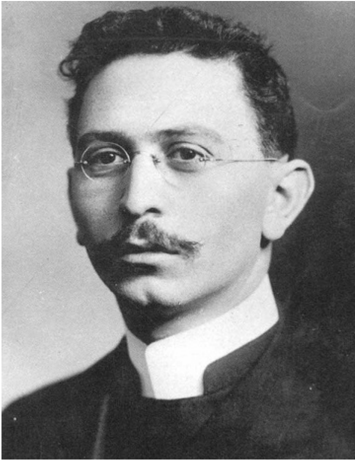
В годы миссионерской молодости