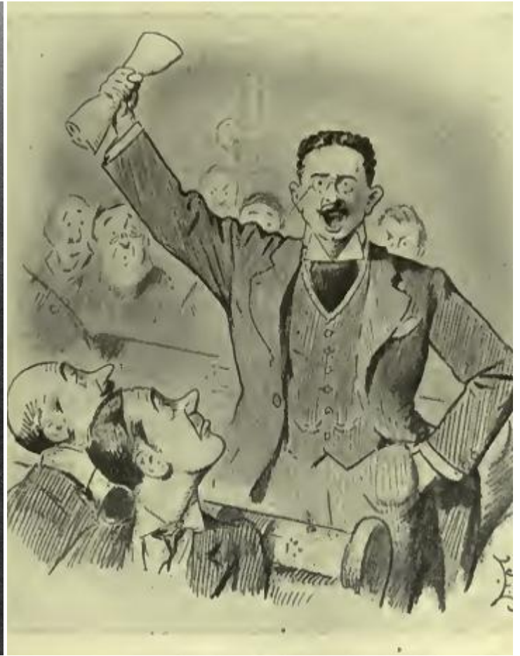
Требиш-Линкольн выступает в Палате общин