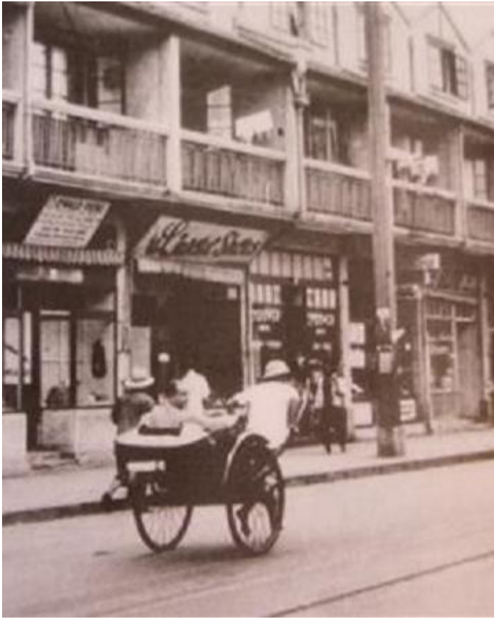
На улице шанхайского гетто