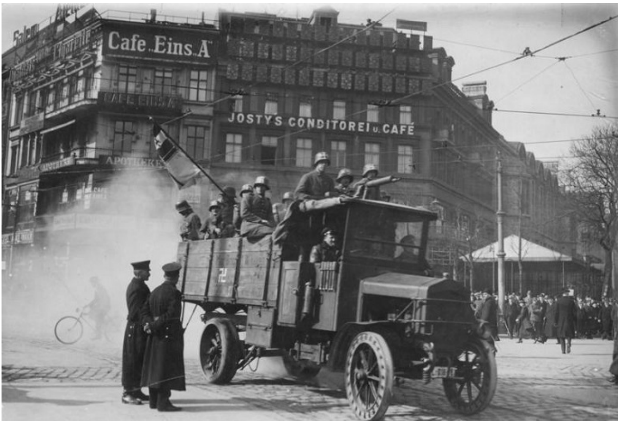
Путчисты Каппа на Потсдамской площади

11 августа 1919 года в стране формально устанавливается республика, получившая название Веймарской. В это время в Берлин прибывает «британский изгнанник» Игнац Требиш-Линкольн, причем без средств к существованию. Духом бывший миссионер не падает и начинает прокладывать путь наверх, примкнув к крайней правой части политического спектра. Среди его новых знакомых — основатель радикально правой Немецкой партии отечества Вольфганг Капп. Вскоре его сторонники переходят к активным действиям — в марте 1920 года Капп организует военный путч, демократическое правительство бежит из Берлина.