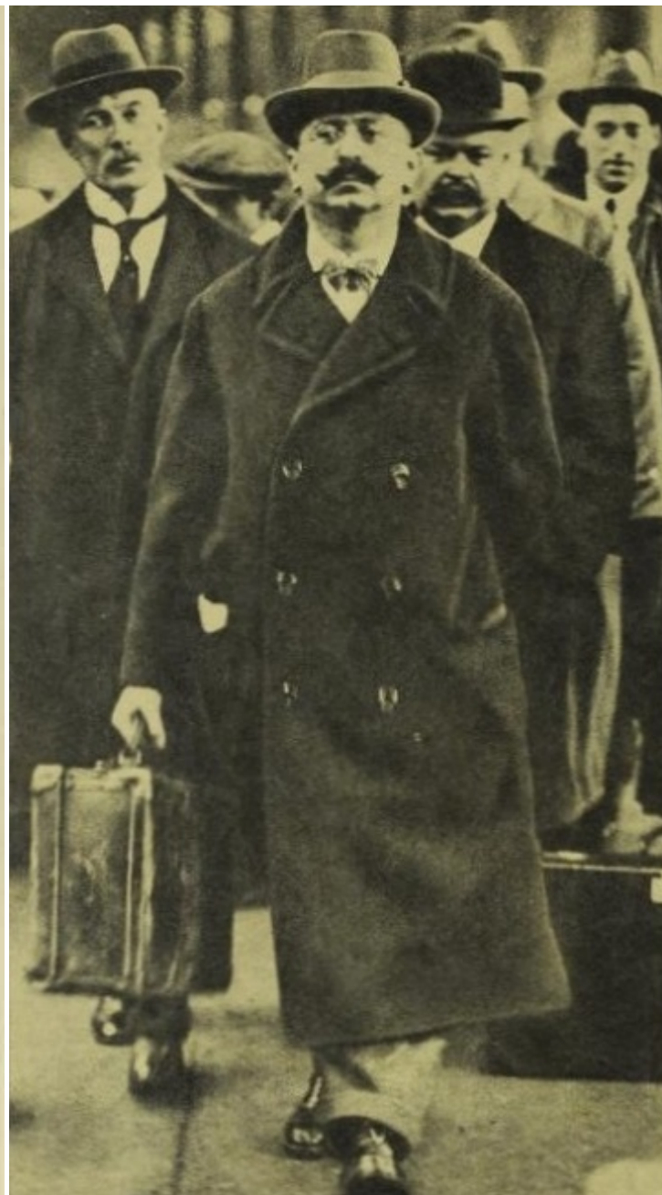
Высылка Требича-Линкольна из США