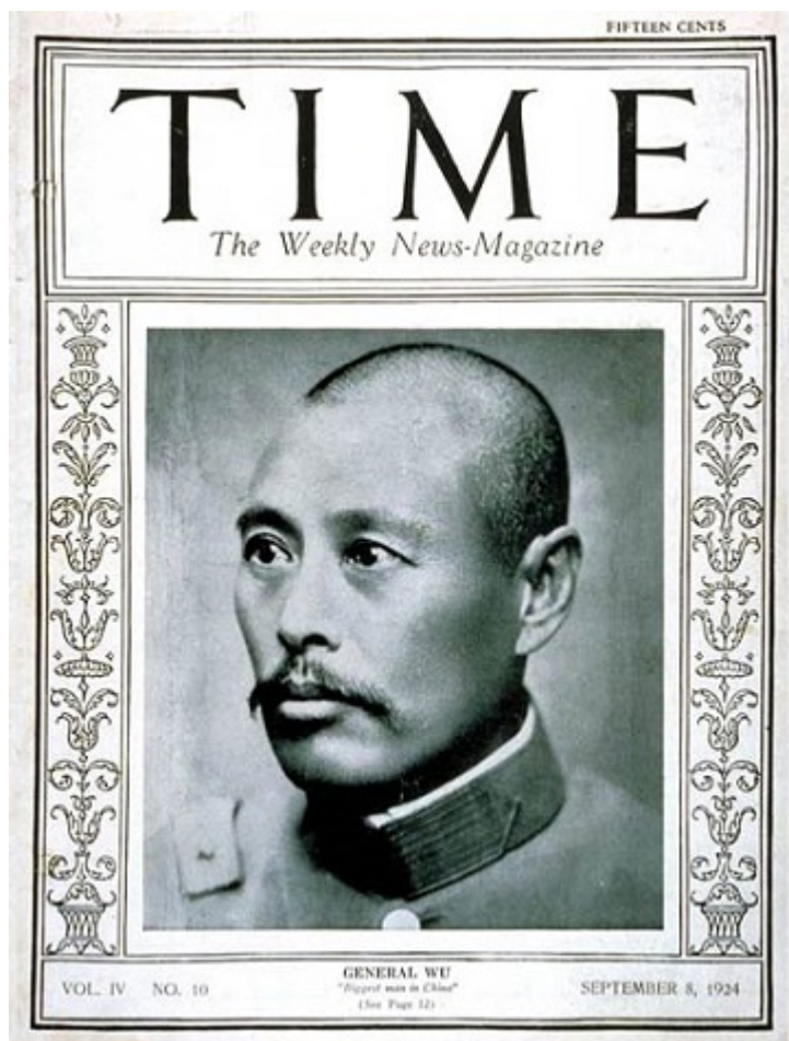
У Пэйфу на обложке Time