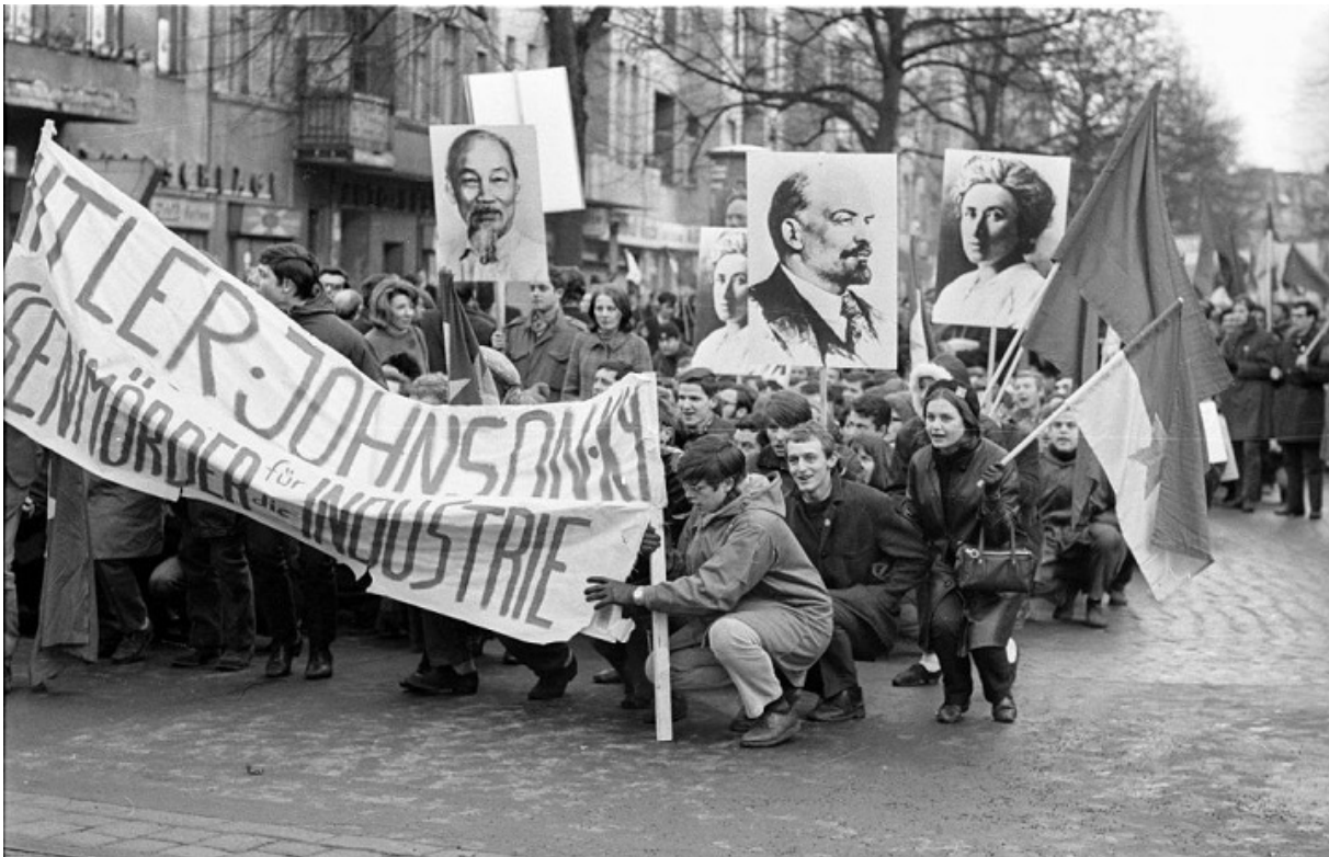
Портреты Розы Люксембург на студенческой демонстрации, Западный Берлин, 1968

Всё это было ей прощено в Советской России, поскольку революция нуждалась в великомучениках. «Мы смело в бой пойдём за власть Советов, и как один умрём в борьбе за это...». Троцкий объявил Розу Люксембург «мученицей революции». Трудно сказать, какие соображения не позволили несостоявшемуся священнику Сталину развенчать уже канонизированную мученицу. Возможно, причина в том, что Сталин был куда мягче к женщинам-революционеркам, чем к мужчинам. Он оставил в живых большинство революционерок ленинского окружения, тогда как под корень уничтожил мужскую часть ленинской гвардии. Мы родились уже в мире, где Роза Люксембург стала именем улиц и площадей, сёл и кондитерских фабрик. В Германии мне приходилось сталкиваться с крайне левыми, для которых «Красная Роза» тоже была сентиментальной иконой на плакатах.