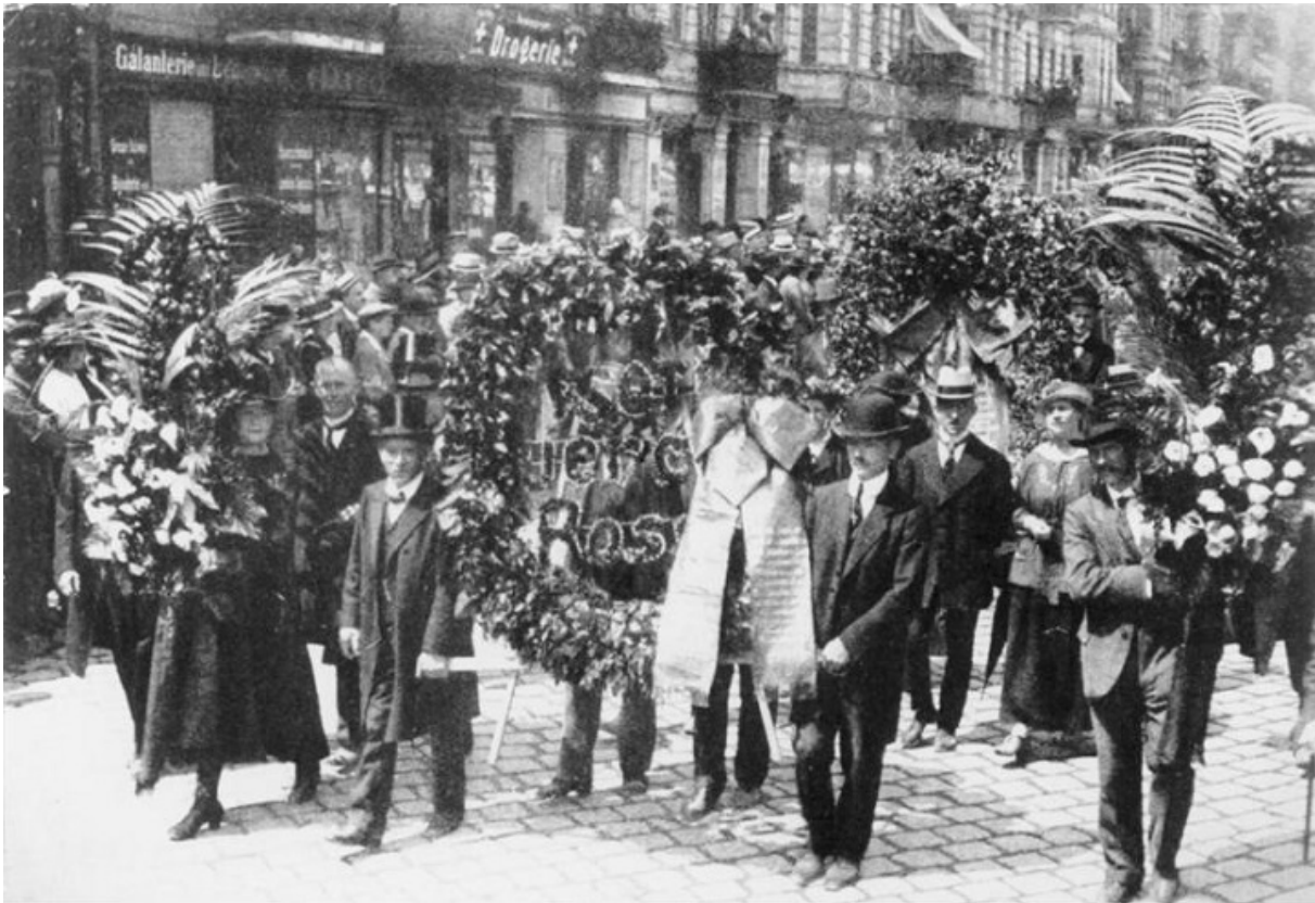
Траурная процессия на похоронах «мученицы революции»

Роза Люксембург вместе Карлом Либкнехтом была убита конвойными по дороге в тюрьму Моабит 15 января 1919 года. Прошло сто лет, и стало отчётливо видно, что Бернштейн был ближе к истине, чем Люксембург. Однако наша вера в «либерализацию рынка», в приватизацию всего общественного и коммерциализацию всего частного очень похожа на веру Розы Люксембург в «освобождение труда». Если бы все было так просто, то самые богатые из нас первыми бы проявляли сознательность и с готовностью платили бы налоги и посылали своих детей на войну. Мы знаем, что это не так. Общество не обречено ни на классовую борьбу, ни на имущественное неравенство, ни детерминировано никакими социальными силами. Общество — это то, что мы сами из него делаем.