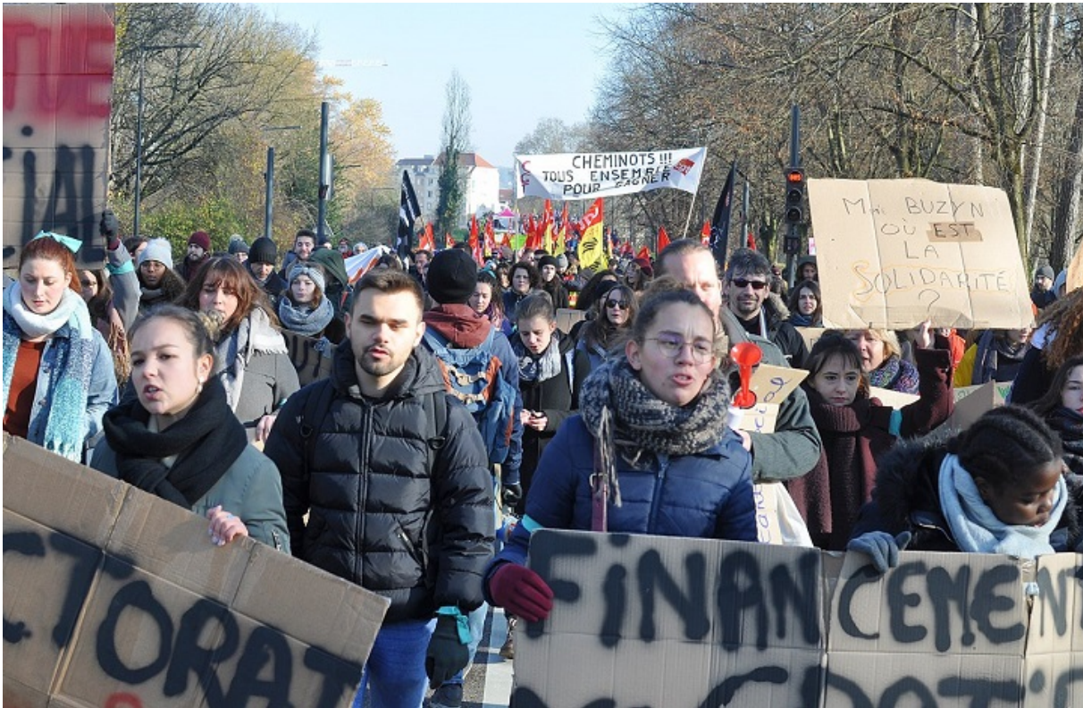
Протест против пенсионной реформы, Франция, 2019

Роза Люксембург — несомненно, один из крупнейших теоретиков левого крыла Второго интернационала. И не только теоретик. Во время революции 1905 года в России она отправилась в восставшую Варшаву и от бастующих польских рабочих переняла уверенность в том, что всеобщая забастовка может опрокинуть капитализм.