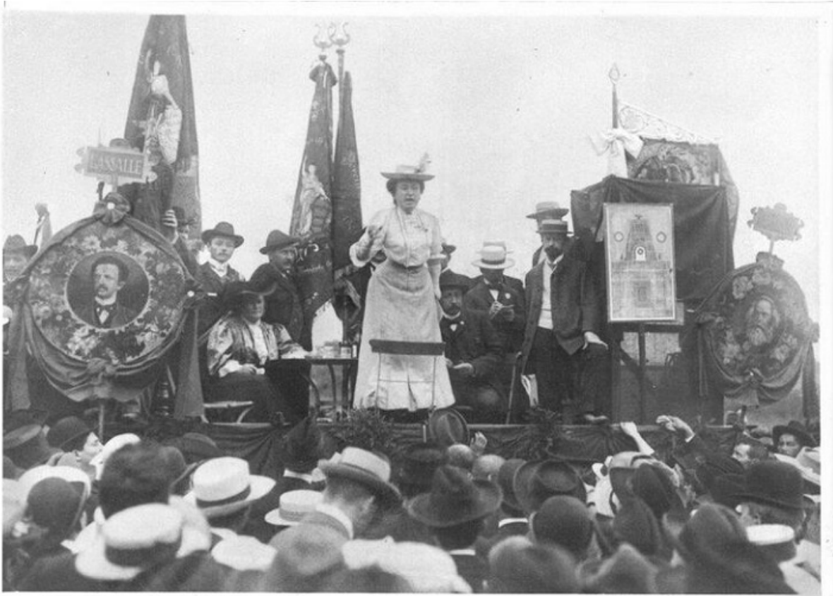
Роза выступает на митинге в Штутгарте, 1907

Кто-то из биографов заметил, что со временем Роза Люксембург выбирала всё более молодых мужчин для любви и всё более старых для ненависти. Одним из таких объектов ненависти стал Эдуард Бернштейн. Ревизионизм тогда ещё не был ругательством, тем более не синонимом для ереси.