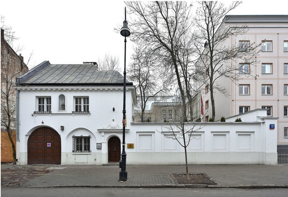
Дом по ул. Эмили Платер, 17, Варшава