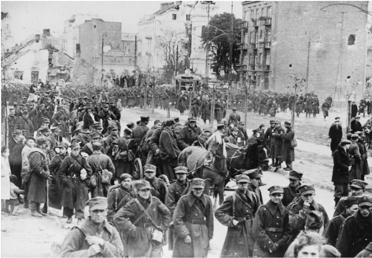
Польские солдаты, плененные вермахтом

Тем не менее, шансы на выживание Ирены без качественно сделанных фальшивых документов были минимальны. Используя свои связи (к тому времени он уже снабжал оружием ячейки Сопротивления), Юзеф обратился за помощью к подпольщикам. Оставалось лишь два «но». Во-первых, хорошие документы стоили дорого, во-вторых, Валащик должен был жениться на Ирене, чтобы легализовать ее фальшивый паспорт. На то и другое Юзеф с легкостью согласился — это была настоящая, хотя и (как признается сегодня мужчина) юношеская любовь.