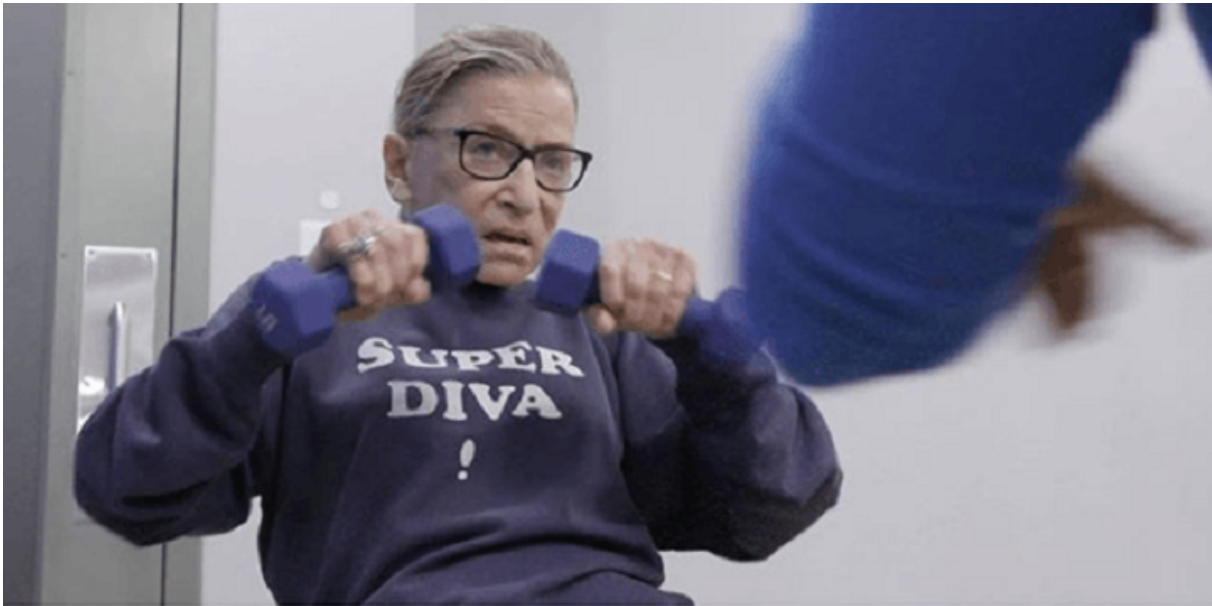
В тренажерном зале.

В 2000-х Рут Бейдер Гинзбург была удостоена всевозможных почестей и наград: Time включил ее в сотню самых влиятельных людей мира, Forbes — в топ-100 наиболее влиятельных женщин, Гарвард и Принстон присвоили почетные докторские степени.