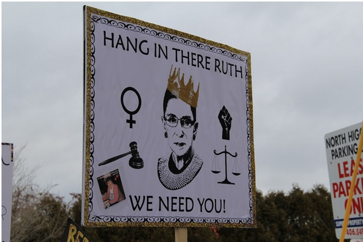
На женском марше

При этом, как Трамп, так и его соперник — Джо Байден, выразили глубокие соболезнования в связи с кончиной Рут Гинзбург.