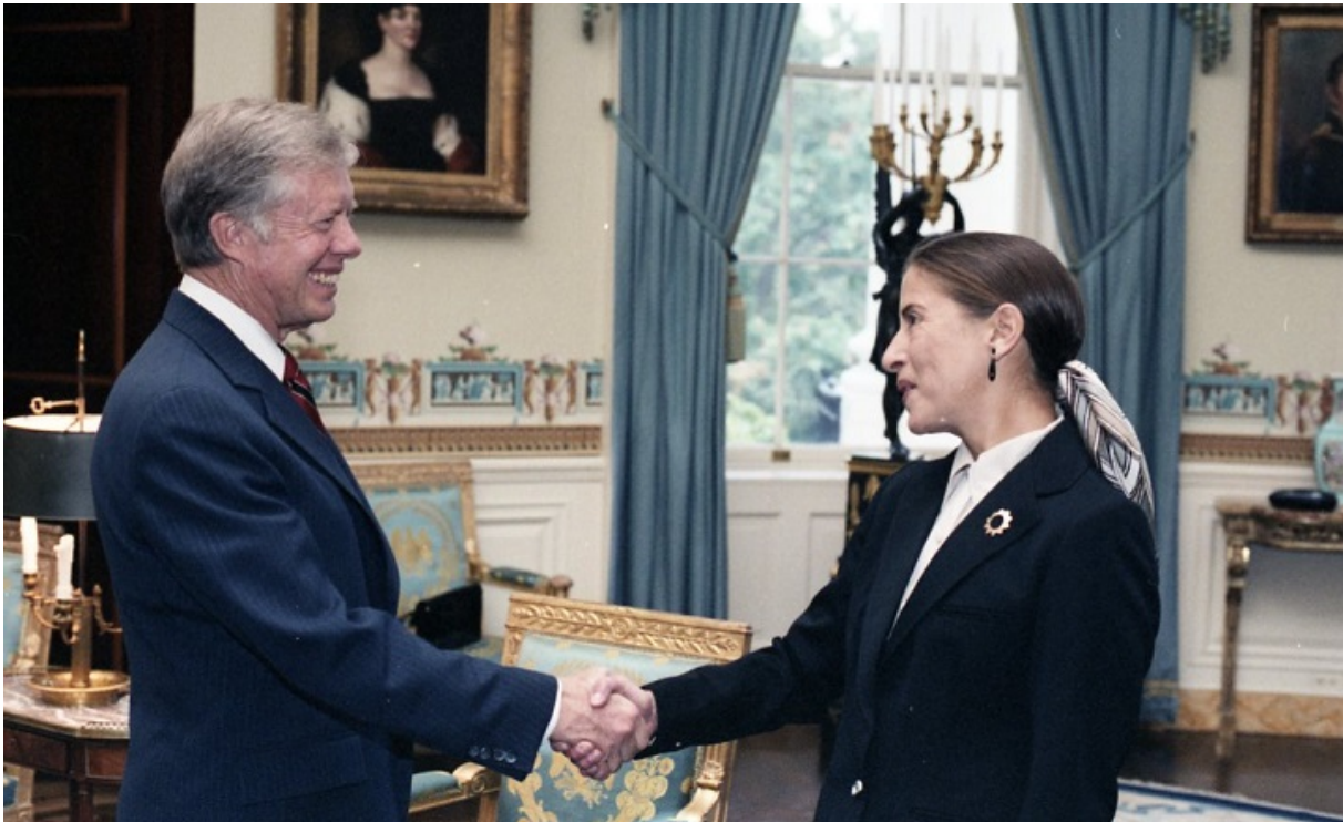
С президентом Картером, 1980