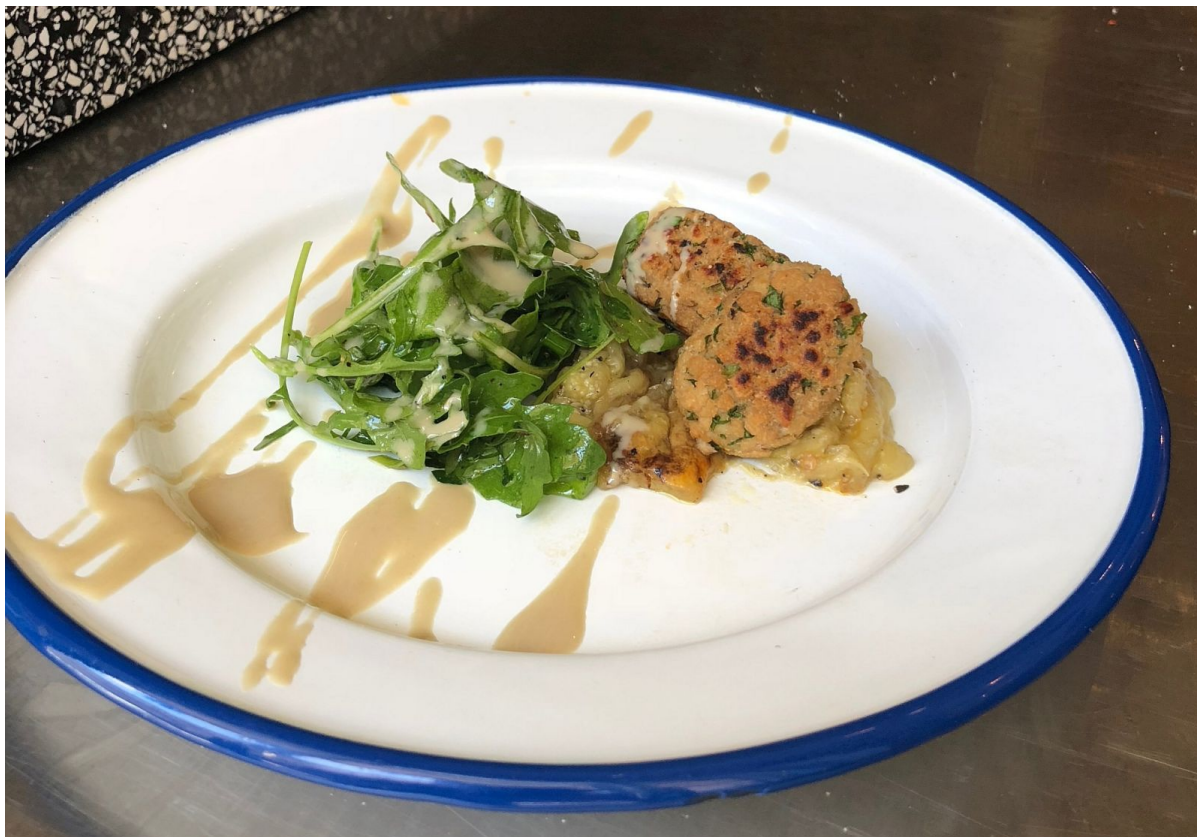
Первый в мире куриный кебаб «из пробирки»

Схема, предложенная израильтянами, проста. Future Meat Technologies поставляет фермерам клетки любого животного, питательные вещества и специальное оборудование для выращивания ткани. После того, как ткань вырастет (примерно через две недели), ее отправят на перерабатывающие заводы, где превратят в мясо, по вкусу практически неотличимое от натурального.