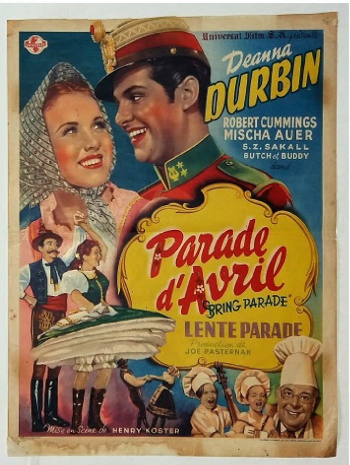
Постери американської версії фільму «Весняний парад»

Незабаром у композитора почали замовляти музику для вистав, а компанія Universal зняла американську версію картини «Весняний парад». Фільм, що вийшов на екрани 27 вересня 1940 року, був номінований на чотири премії Оскар, одну з яких (за кращу оригінальну пісню) отримав Роберт Штольц.