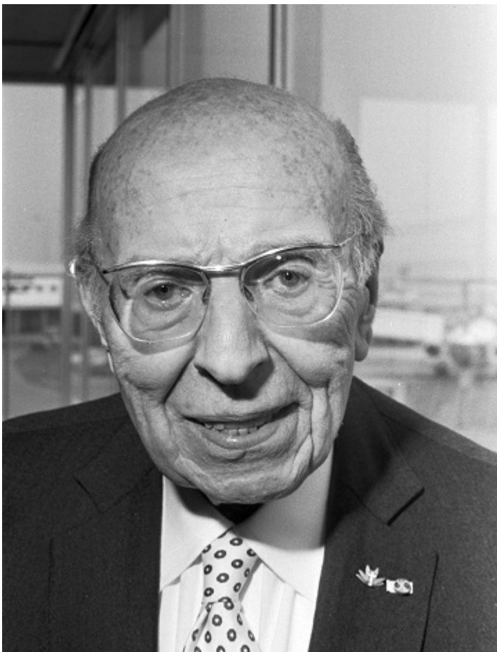
Композитор у 1970 році

Після війни, незважаючи на влаштоване життя у Сполучених Штатах, композитор прагне повернутися до Відня. Як тільки американська окупаційна влада дозволила в'їзд на територію Австрії, дозвіл під №1 було видано Роберту, а під №2 його дружині. 30 листопада 1946 року в Віденському аеропорту їх зустрів мер столиці і кілька тисяч городян. Відень ще в руїнах, постачання йде з перебоями, але для її жителів повернення композитора — символ прийдешнього відродження країни. 66-річний композитор приступає до роботи на рідній землі — нові оперети, музика до фільмів і театральних вистав, записи старих класичних оперет на пластинки.