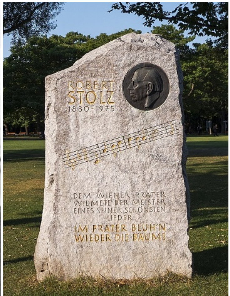
Пам'ятний камінь Штольцу у парку Пратер, Відень