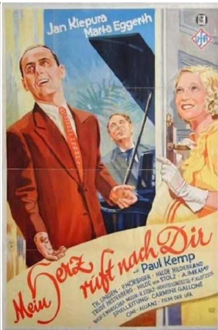
Афіші фільмів, поставлених на музику Штольца

На початку 1930-х Штольц написав музику для трьох десятків кінострічок, не припиняючи створювати виступи для кабаре і писати нові оперети.