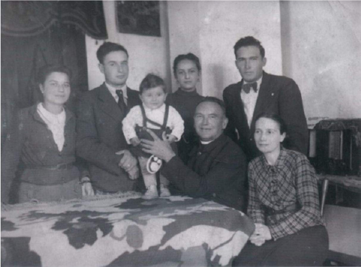
Настоятель з дітьми

Коли в 1939-му прийшли Совети й почалися утиски поляків, священник закликав парафіян не чіпати майно сусідів, присоромив усіх, хто вирішив скористатися ситуацією й поживитися чужим добром. Розповідають, що на самому початку війни енкаведисти прийшли за настоятелем — його врятував наліт німецької авіації. Втім, приходу нацистів він не зрадив: «На місце одного пана прийшов інший, лише гудзики на мундирах змінилися».