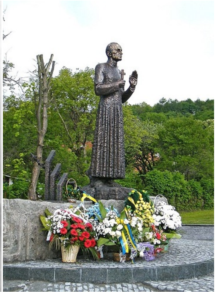
Омелян Ковч та пам'ятник священику в Перемишлянах

Понад на півстоліття ім'я Омеляна Ковча було забуто, аж до беатифікації його Папою Римським. Щоправда, раніше — у вересні 1999 року — Єврейська Рада України присвоїла отцю Ковчу звання «Праведник України». Лише у 2002 році з'явилася меморіальна дошка в Перемишлянах, а у 2009-му — у Майданеку. 11 травня 2012 року в Перемишлянах був урочисто відкритий пам'ятник священику, який освятив сам предстоятель УГКЦ Святослав.