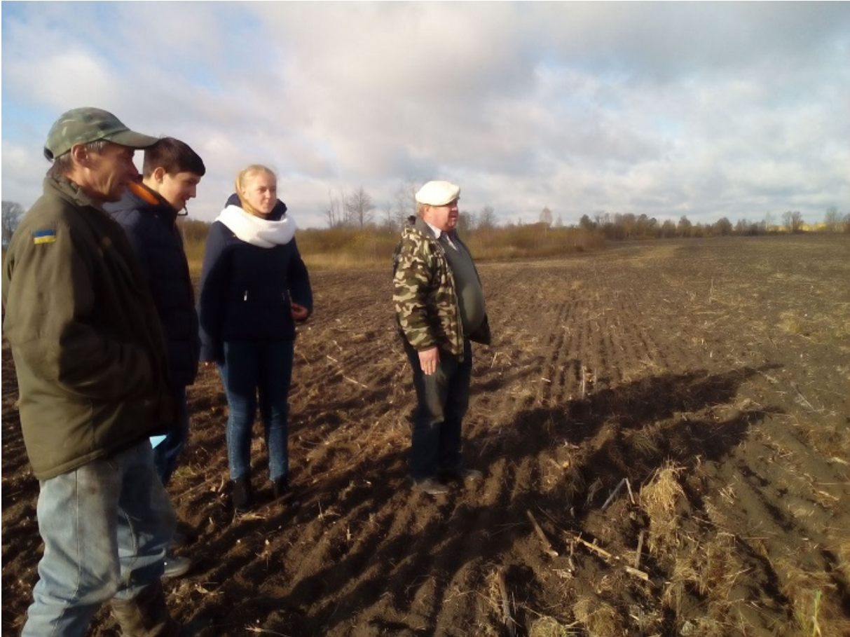
Місце розстрілів жителів села Скурати

Насип приблизно 30-метрової довжини жителі села Скурати, що в 100 кілометрах від Житомира, називають «місцевим Бабиним Яром». У вересні 1941-го тут у чистому полі були розстріляні приблизно 500 євреїв — із самого села Скурати, райцентру Чоповичі й кількох навколишніх сіл.