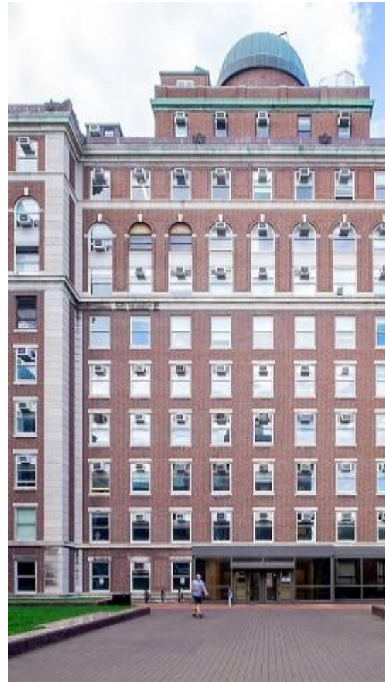
Департамент Фізики Колумбійського університету

У 1950 — 1968 роках Стейнбергер — професор Колумбійського університету, де спільно з Леоном Ледерманом і Мелвіном Шварцем уперше ідентифікував нейтрино в лабораторних умовах. Батьки Ледермана приїхали з Одеси та Києва, Шварци теж були єврейськими іммігрантами.