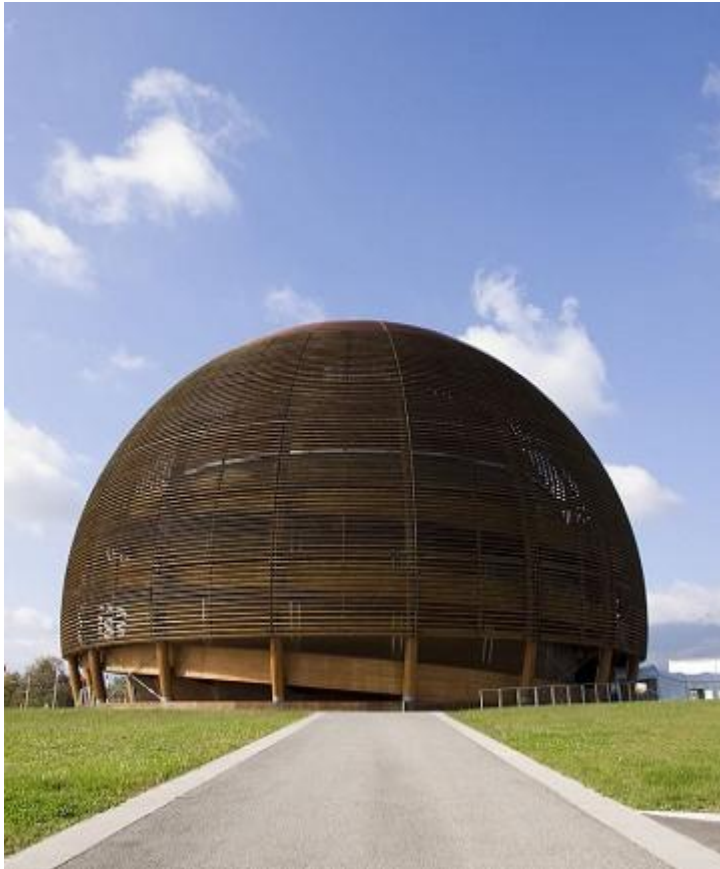
Музей науки та інновацій при ЦЕРН

У 1988 році Джек Стейнбергер із Ледерманом і Шварцем був удостоєний Нобелівської премії. Свою Нобелівську медаль він вручив середній школі в штаті Іллінойс, яку закінчив ще до війни. У тому ж році фізик був нагороджений Національною медаллю науки тодішнім президентом США Рональдом Рейганом.